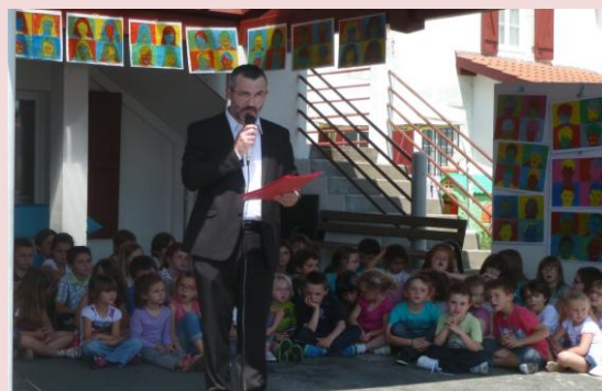
Discours de M. le Président de l'OGEC

Regard sur le partenariat humain et financier, car sans la belle énergie déployée par les hommes et les femmes, institutionnels et bénévoles, impliqués dans cette aventure et les financements, nécessairement privés, qui vont avec, rien de grand et de pédagogiquement abouti ne peut naître