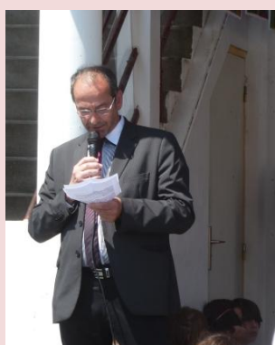
Réponse de M. le Maire

Regard historique d'abord, pour inscrire dans la continuité les efforts en faveur du bilinguisme Basque-Français, de l'accueil des plus petits, des projets pédagogiques plurilingues et à haute valeur ajoutée.