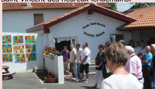
Vue de l'assistance