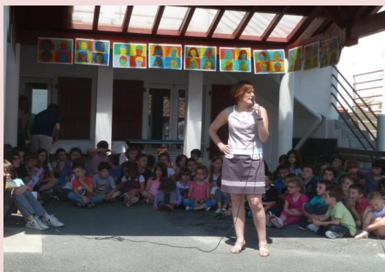
Accueil de Mme la Directrice