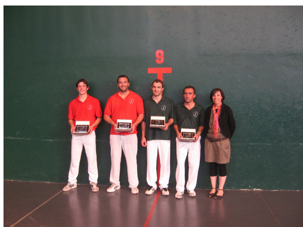
1 ère série : Duguine-Belestin/Lagnet-Clavierie