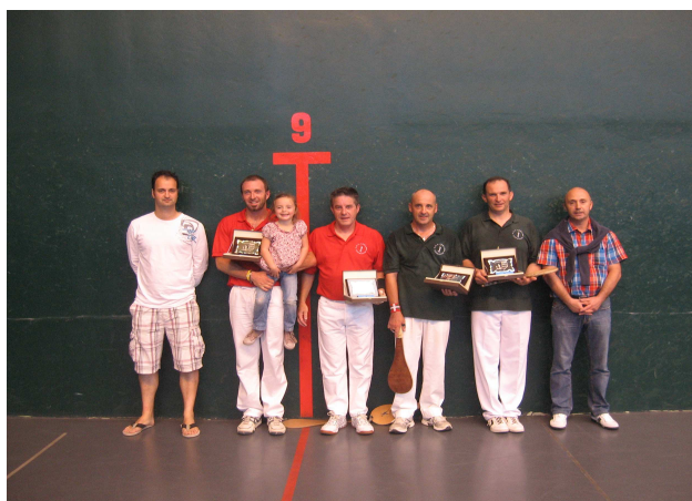
3 ème série : Estomba-Dauphin/Comets-Albertini